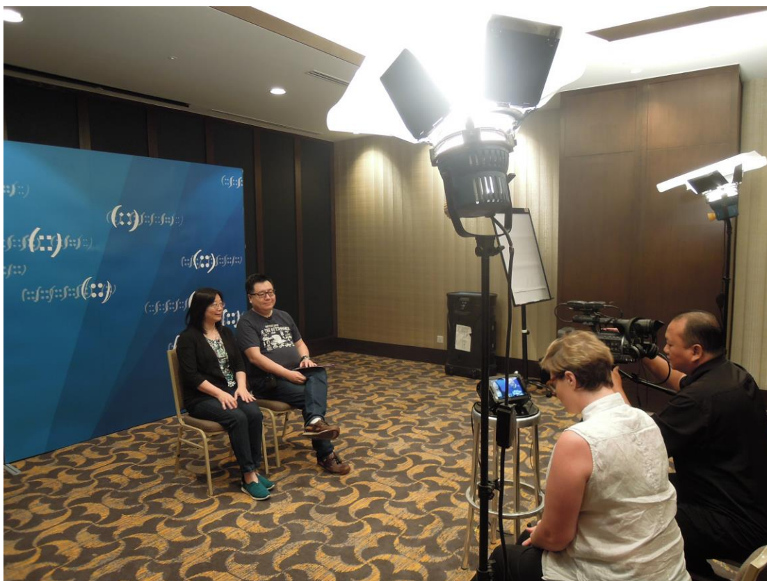
為宣傳 APNIC 44 次會議在台中錄製中英文宣傳影片。