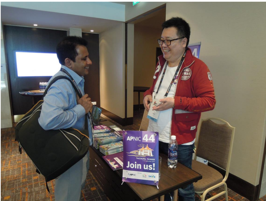
與會者與現場諮詢人員詢問 APNIC 44 次會議相關問題及交流台灣網路產業現況。