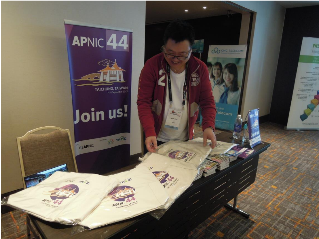
現場展示會議宣傳提袋。