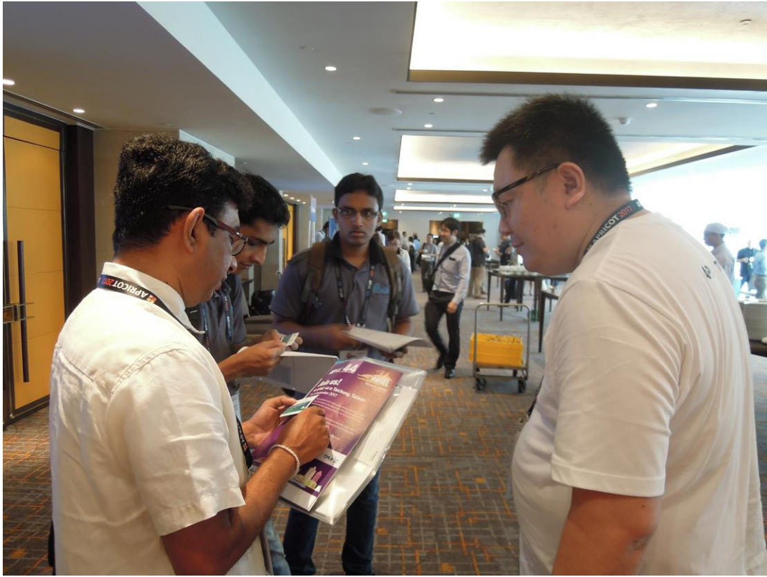
現場諮詢人員主動遞發文宣品及介紹 APNIC 44 次會議及台中市。