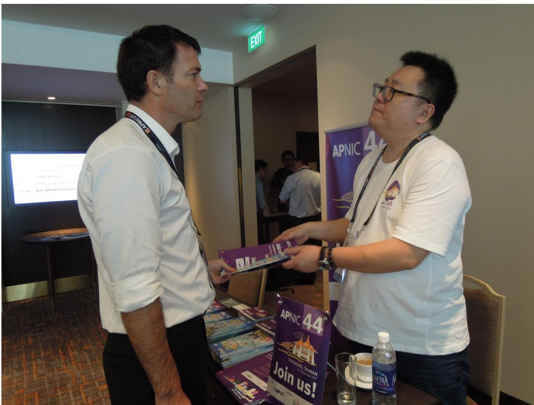
現場諮詢人員廣發文宣品，讓與會者索取參考。