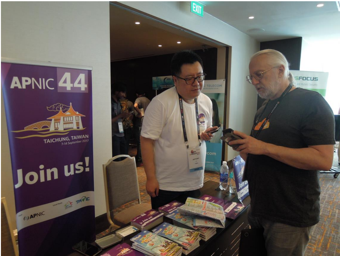
與會者對台中非常有興趣，看完台中觀光簡介後，與現場諮詢人員討論並詢問相關問題。