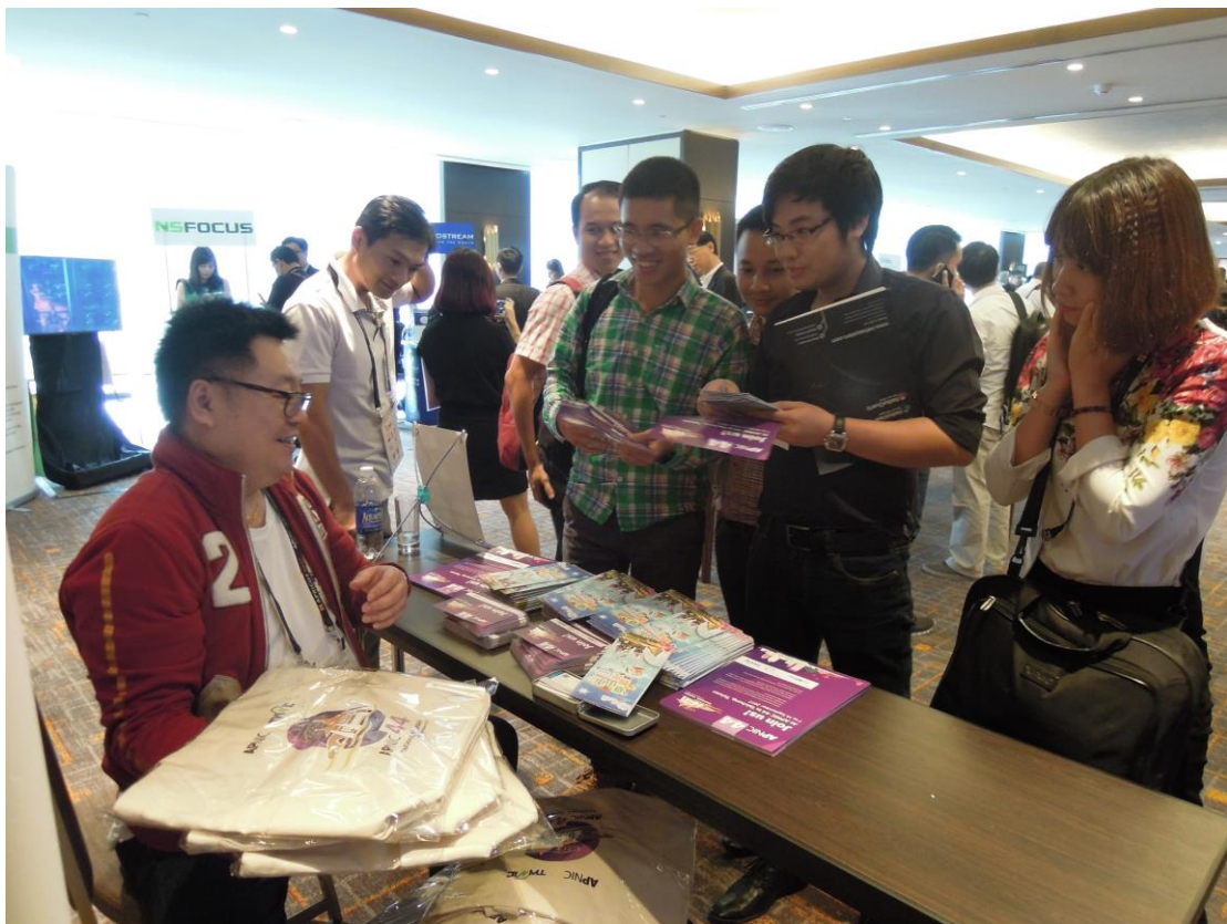
許多與會者對 APNIC 44 次會議及台中富有興趣，前來詢問，諮詢人員一一回答與介紹。