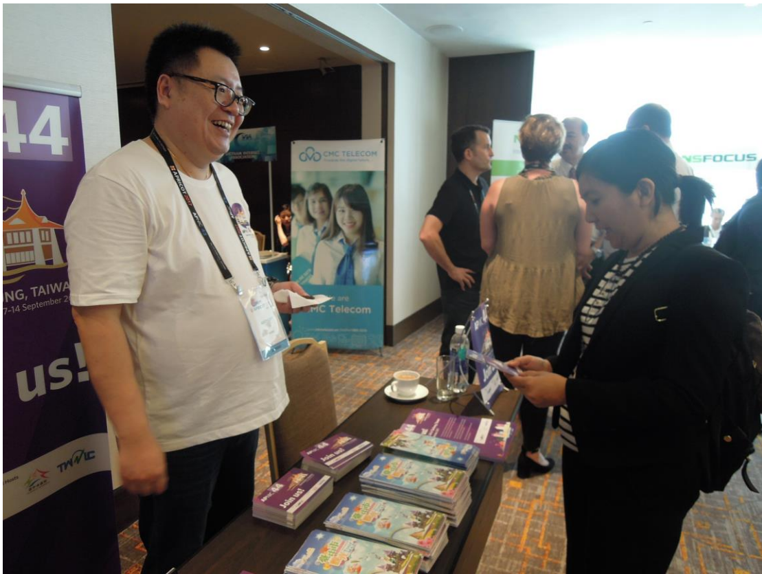
許多與會者前來諮詢處索取文宣。