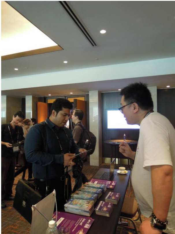
與會者前來詢問 APNIC 44 次會議相關問題，現場諮詢人員一一回答。